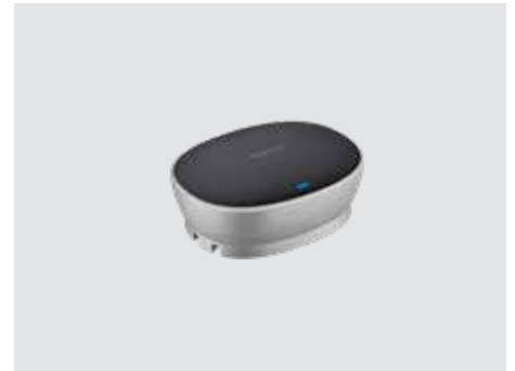
ANSCHLUSSMÖGLICHKEITEN UND VERWENDUNG

Erweitern Sie den Gesprächsbereich von 6 m (20 Fuß) auf 8,5 m (28 Fuß), damit auch die von der Freisprecheinrichtung weiter entfernten Personen deutlich gehört werden. Mikrofone (paarweise verfügbar) werden automatisch erkannt und konfiguriert, indem Sie sie einfach an die Freisprecheinrichtung anschließen.